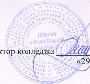
График учебного процесса на II полугодие 2017 – 2018 учебного года Отделение педагогики, специальность 53.02.01 «Музыкальное образование»

УТВЕРЖДАЮ Директор колледжа «29» декабря 2017 г.