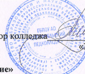
График учебного процесса на I полугодие 2017 – 2018 учебного года Отделение педагогики, специальность 44.02.01 «Дошкольное образование»