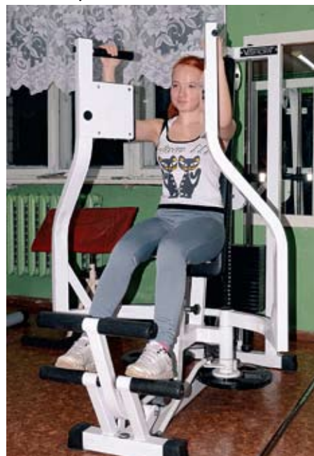
Новые тренажеры никогда не простаивают