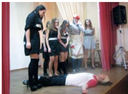
КВН, команда «Пельмешки»