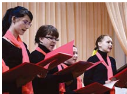
Хор студентов колледжа

- Я с музыкой связана с самого детства. Всю сознательную жизнь играю на фортепиано. Музыкальное образование для меня увлечение, профессия – вся жизнь.