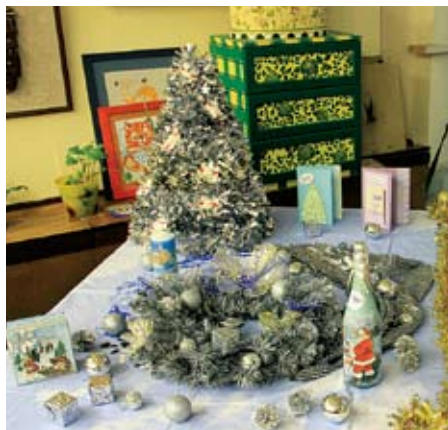
■ Мастер-класс по техникам декорирования