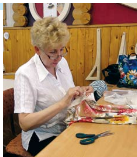
■ Занятия по «Кройке и шитью»

низаций» (Основы работы в программе Microsoft Office Word, Excel, PowerPoint, FrontPage, Access, Adobe Photoshop, применение интерактивной доски в образовательном процессе, создание и оформление сайта организации);