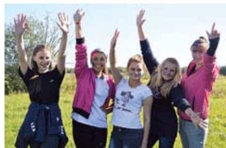
Поход первокурсников, 2013 год