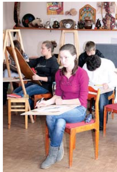
Занятия по «Рисунку и живописи»

Окончив обучение по данной профессии, выпускники успешно поступают в высшие учебные заведения по направлению архитектуры и дизайна, продолжая реализовывать свои самые смелые творческие идеи.