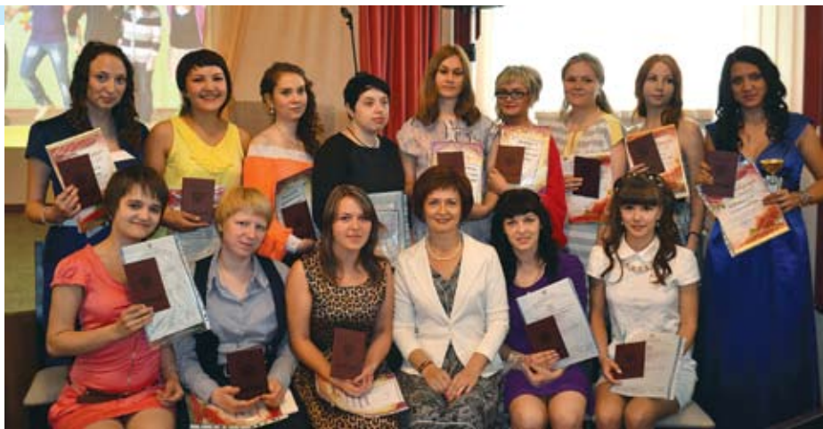
Отличники 2013 года

АПК даёт знания для жизни . Даже если ты не будешь трудиться по избранной специальности, полученные знания помогут тебе воспитывать собственных детей, благоустроить свой дом, составлять разнообразные маршруты ин-