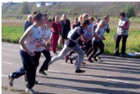
Кросс «Золотая осень»