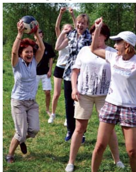
Поход. Выигрывает команда преподавателей

В памяти выпускников колледжа надолго останутся выпускные вечера. А годы учебы в колледже дали им не только возможность получить специальность, но и быть сопричастными к студенческому братству. Чем активнее студенты приобщаются к различным делам, тем быстрее они социально адаптируются к взрослой жизни. И наша задача - помочь молодым людям увидеть свои положительные качества, побудить их к совершенствованию самих себя. А это и есть курс на успешность человека в дальнейшей жизни!