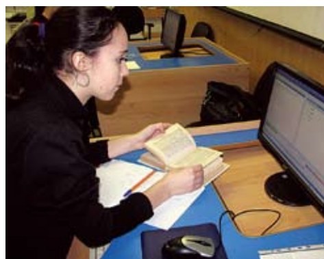
В компьютерном кабинете

Успешная работа документоведа может способствовать его карьерному росту в компании с последующим занятием должности офис-менеджера, менеджера организационного отдела.